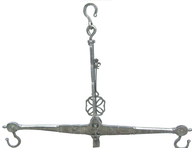
Fléau en fer forgé (datable du XVIII e siècle).