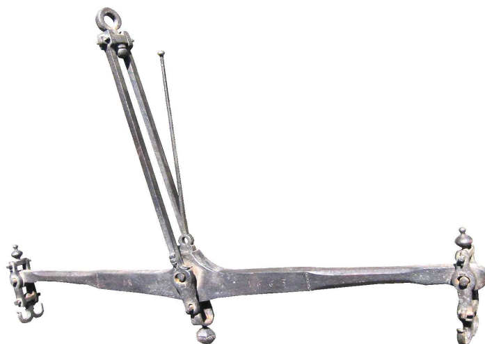
Grand fléau en fer forgé explicitement daté de 1663.