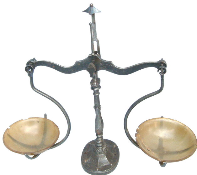
Petite balance à colonne, pour le tabac, de marque Garat à Caen (datable vers 1860).