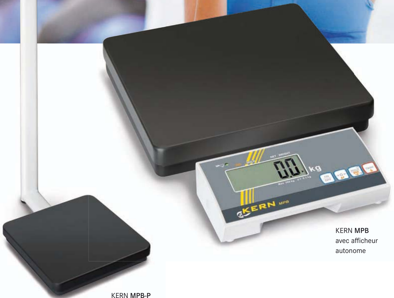
KERN MPB avec afficheur autonome