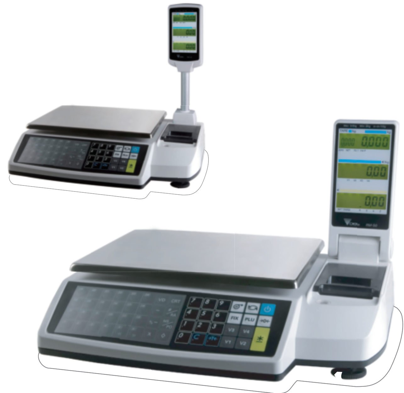
Variante : Afficheur LCD rétro éclairé, repliable ou sur colonne

DIGI BELGIUM NV Neerlandweg 7 2610 Wilrijk Tel : 03 325 81 01 Fax : 03 325 85 88 Email : verkoop@digieu.eu Website : www.digieu.eu