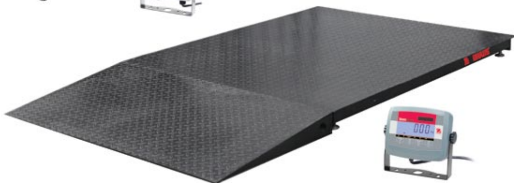
Plate-forme et rampe en acier peint avec indicateur T31P