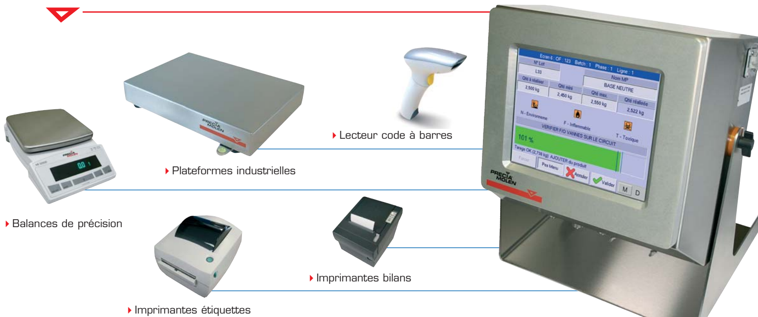
▶ Lecteur code à barres