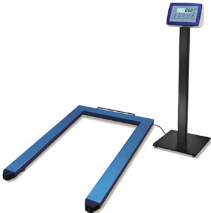
EPW15 avec colonne optionale CSP