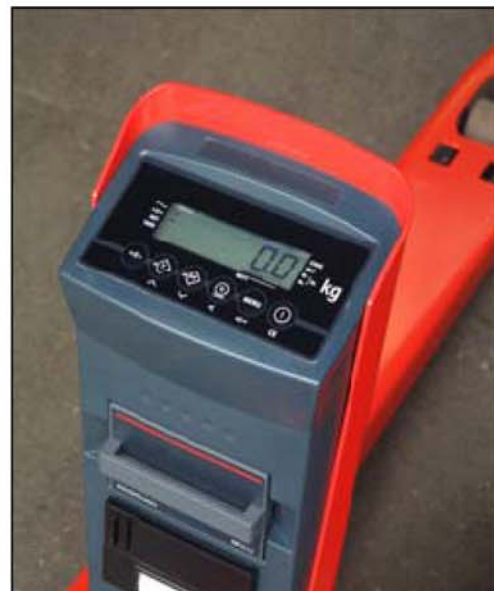
Afficheur digital d'utilisation facile